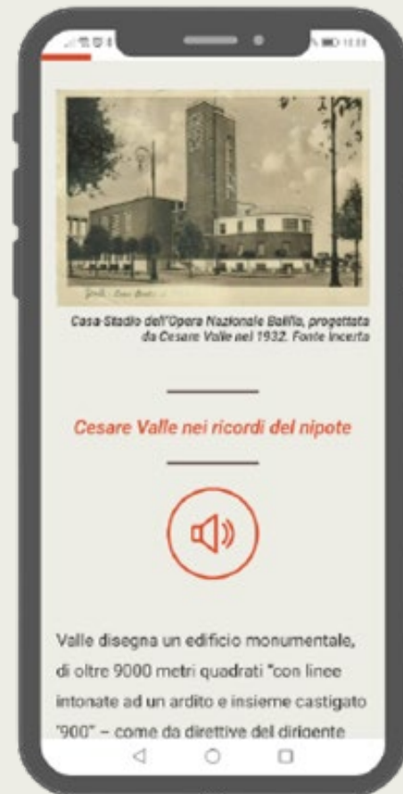
Domenico Guzzo Istituto Storico della Resistenza

Partecipando a Come In ho imparato a condividere l'elaborazione progettuale a partire da punti di vista ed interessi altri rispetto alla scienza (e alla divulgazione) storica.